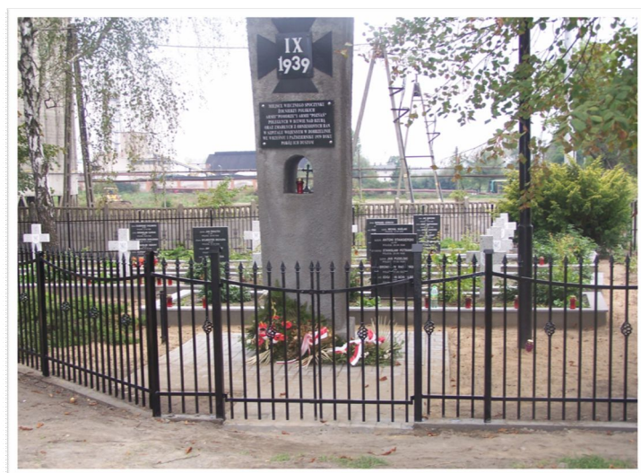
Zdj. Przydrożny cmentarz wojenny

W miejscowości znajduje się także miejsce wiecznego spoczynku Żołnierzy Polskich Armii „Pomorze” i Armii „Poznań” poległych w Bitwie nad Bzurą oraz zmarłych z odniesionych ran w szpitalu wojennym w Dobrzelinie we wrześniu i październiku 1939r. Co roku wraz z uroczystościami wrześniowymi składane są przez mieszkańców, władze, uczniów kwiaty upamiętniające tamte wydarzenia.