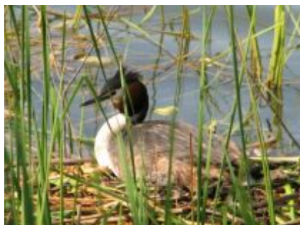
Zdj. Stawy Dobrzelińskie

W miejscowości Dobrzelin występują skupiska drzew tworząc parki i zadrzewienia śródpolowe, które tworzą odpowiedni klimat przyrodniczy. Są też nacieki wodne w postaci stawów, które niegdyś wykorzystywane były w celach gospodarczych przez Cukrownię teraz dzierżawione przez Stowarzyszenie Wędkarzy. Te miejsca niegdyś izolowały mieszkańców od zgiełku, hałasu i dawały spokój i ukojenie. Teraz z uwagi na wieloletnie zaniedbania wymagają uporządkowania i odpowiedniego zagospodarowania. Gmina Żychlin rozpoczęła już proces inwestycyjny polegający na zagospodarowywaniu terenów i na jednym utworzyła plac zabaw dla dzieci w centrum miejscowości. Ale jest jeszcze wiele miejsc, o które zapewne trzeba zadbać nie tylko ze względu na aspekt społeczny, ale także i ze względu na ochronę środowiska. Bowiem są to siedliska dziko żyjących zwierząt, ptaków i owadów.