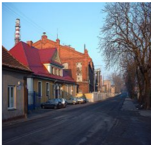
Zdj. Zabudowa „Cukrowni Dobrzelin”

Z kolei na terenie cukrowni „Dobrzelin” zachowało się kilka budynków z drugiej połowy XIX wieku, będących przykładem architektury przemysłowej (fabrycznej) z tego okresu.