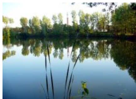
Zdj. Widok Stawów Dobrzelińskich