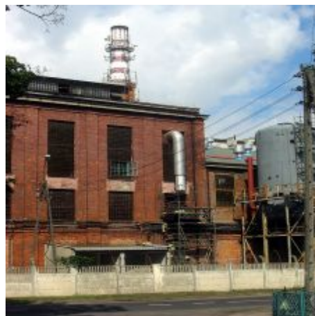
Zdj. Teren „Cukrowni Dobrzelin”