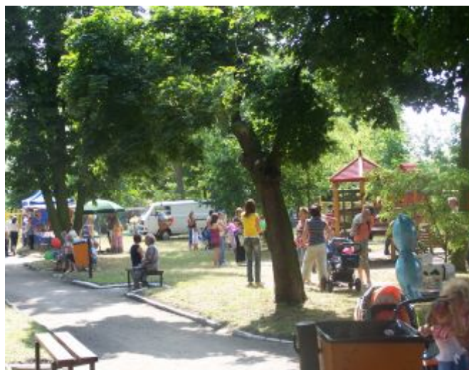
Zdj. Park wraz z placem zabaw

W miejscowości oprócz dość dobrze rozwiniętej strefy gospodarczej nie ma możliwości rozwijania się przez mieszkańców w strefie społeczno-kulturalnej. Bowiem nie ma w miejscowości świetlicy, szkoły, biblioteki ani domu kultury. Tak naprawdę tylko zespoły parkowe dają szansę przystani, rekreacji i wypoczynku dla mieszkańców. Dlatego też Gmina Żychlin w 2008 roku w jednym z nich utworzyła plac zabaw dla dzieci. Jednak potrzeba jeszcze wielu środków finansowych na rekultywację tychże terenów i dostosowania ich do pełnienia funkcji społeczno-kulturalnych.