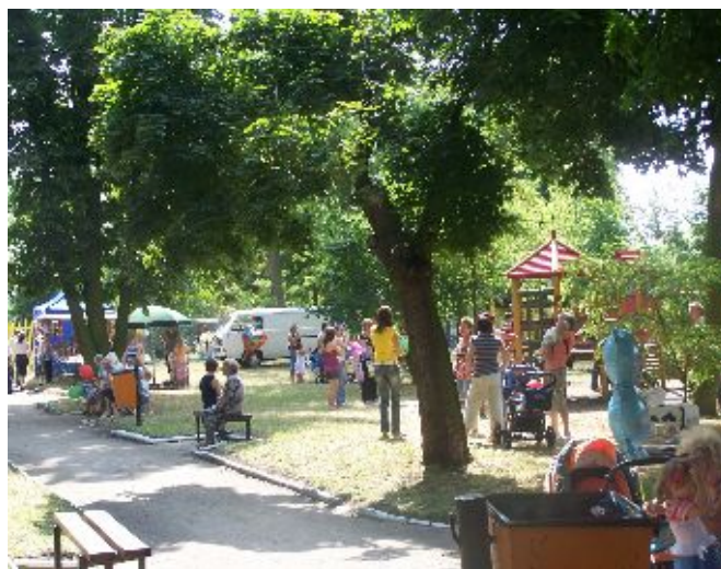
Zdj. Park wraz z placem zabaw

W miejscowości oprócz dość dobrze rozwiniętej strefy gospodarczej nie ma możliwości rozwijania się przez mieszkańców w strefie społeczno-kulturalnej. Bowiem nie ma w miejscowości świetlicy, szkoły, biblioteki ani domu kultury. Tak naprawdę tylko zespoły parkowe dają szansę przystani, rekreacji i wypoczynku dla mieszkańców. Dlatego też Gmina Żychlin w 2008 roku w jednym z nich utworzyła plac zabaw dla dzieci. Jednak potrzeba jeszcze wielu środków finansowych na rekultywację tychże terenów i dostosowania ich do pełnienia funkcji społeczno-kulturalnych.