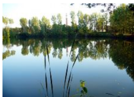
Zdj. Widok Stawów Dobrzelińskich