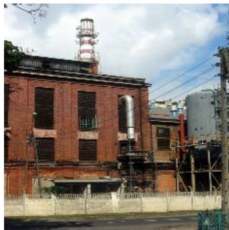
Zdj. Teren „Cukrowni Dobrzelin”